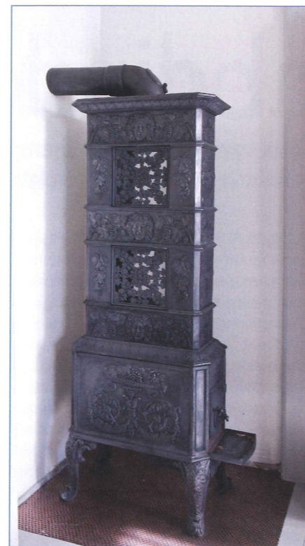
En staselig etasjeovn inngår i miljøet