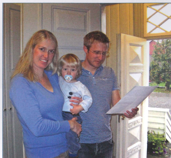
Tre firedeler av dagens beboere. Legg merke til inngangsdøra – den er godt bevart, jf. det gamle bildet til høyre.