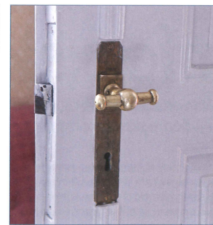
Interørdetalj – messinghåndtak på dør

eksemplet som trekkes fram. En vakker, fredet hovedbygning med halvvalmet tak og to sammenhengende fløybygninger – østfløyen for tjenerskap, vestfløyen for vogner, ved og utedo. Linstow tegnet også fløyer til Slottet, men der ble de aldri oppført. Prestegården har sine funksjoner