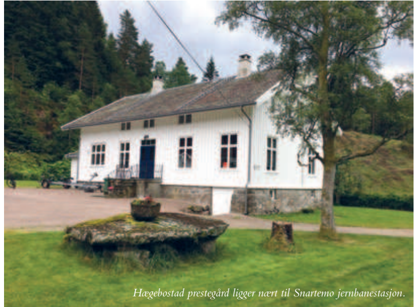
Hægebostad prestegård ligger nært til Snartemo jernbanestasjon.

Hægebostad prestebolig ligger nord i Lyngdal og øst for Kvinesdal. På en stille julidag tok jeg turen for å bli kjent med stedet og ikke minst presteboligen som Opplysningsvesenets fond rehabiliterte i 2016.