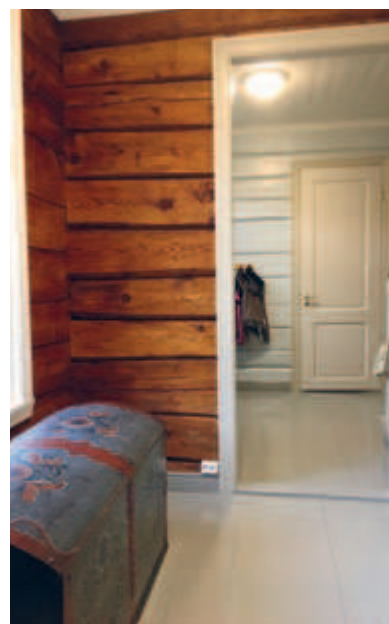
Gang med malte tømmervegger: Under plater og tapet ble gamle laftevegger avdekket.