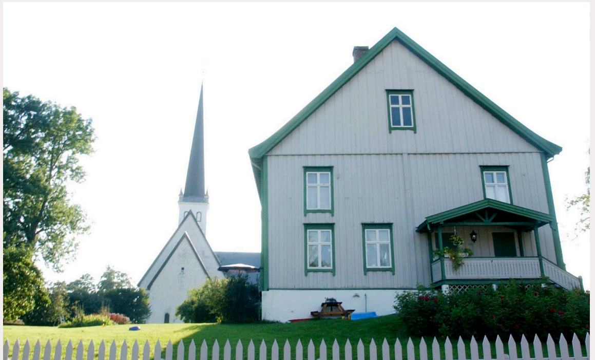
Fondet springer ut av et eierskap til prestegårdene spredt utover landet og er en av Norges største grunneiere, skriver forfatteren. Her fra Stange prestegård ved Mjøsa.

For å kunne skape økte verdier og overskudd er OVF av lovgiver pålagt å drive på markedsmessige vilkår. Det kolliderer av og til med de forventningene enkelte kan ha til et fond med tilknytning til kirken. Av og til fører det til skuffelse, misnøye og debatter med påstander om at OVF er til