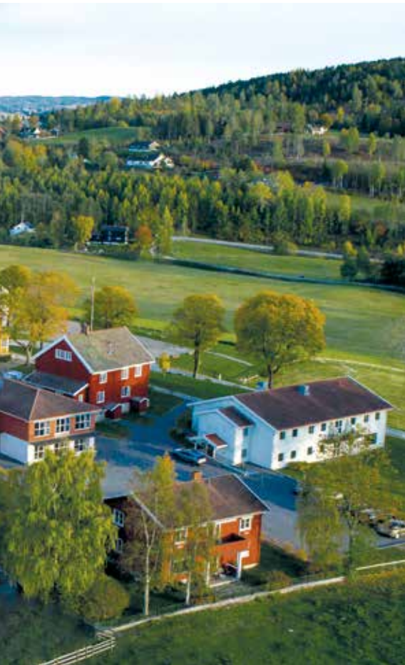
Kulturminner. Granavolden Gjestgiveri med Søsterkirkene i bakgrunnen.

å bygge samfunn på den måten vi har sett på Granavollen. – Det er nettopp samspillet mellom alle aktørene som er suksessfaktoren, sier hun. Og her kan fond og stiftelser ha en utløsende effekt.