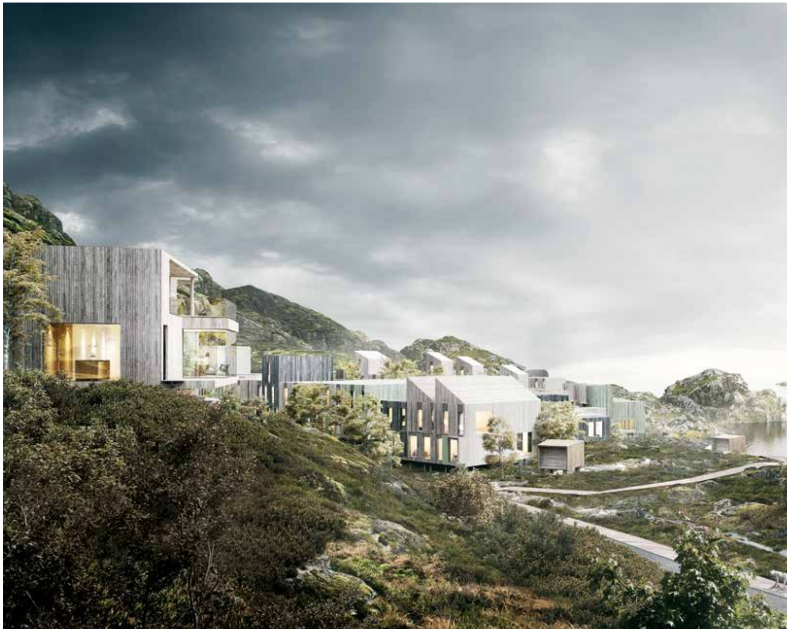
Bærekraftig. Norges første Smarte Nabolag er planlagt bygget ut i Lofoten. Natur og teknologi gjøre prosjektet spektakulært på flere måter.