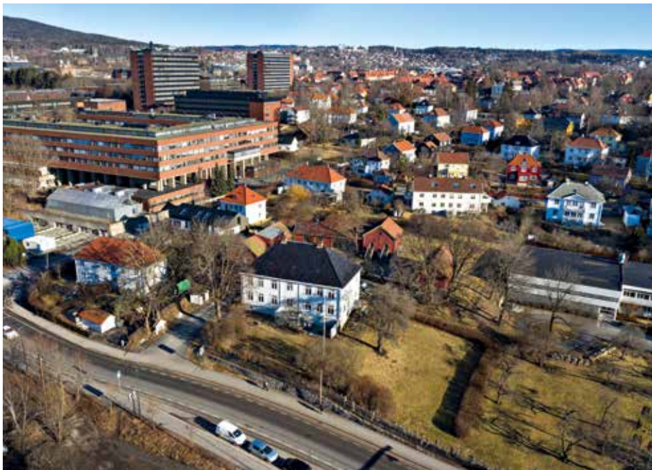
Marienlyst 2021/1950. Marienlyst og Blindern hørte til Vestre Aker. Foto viser NRK-bygget da det sto ferdig i 1950, og Universitetet i dag.