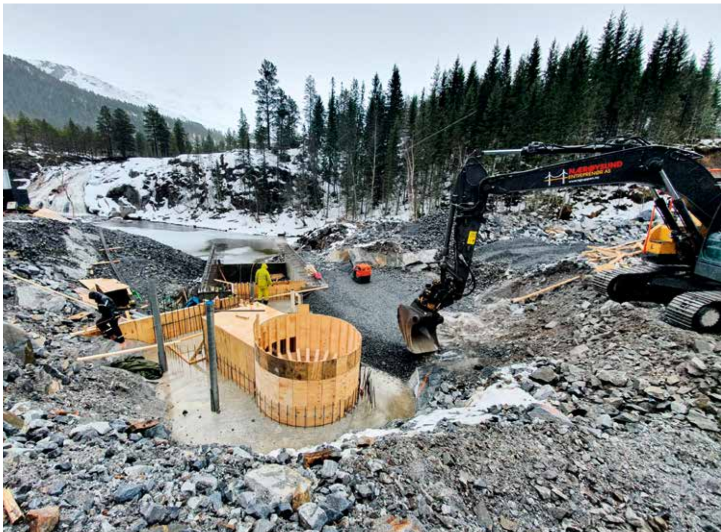
Krafttak. Arbeidet med kraftverk i Hellifossen i Nordland begynte i juni 2019. Kraftverket vil gi ca. 28 Gwh, noe som tilsvarer strøm til ca. 1400 husstander. I anleggsperioden er 8–10 mennesker sysselsatt. Terråk kraftverk vil stå ferdig første kvartal av 2021.

av fornybar energi har sin pris, og setter spor etter seg. Vannkraftutbygging fører med seg inngrep i naturen som følge av vanninntak i elva, endret vannføring og bygging av rørgate og kraftledninger. Dette er inngrep som kan påvirke landskap, fiskebestand og biologisk mangfold.