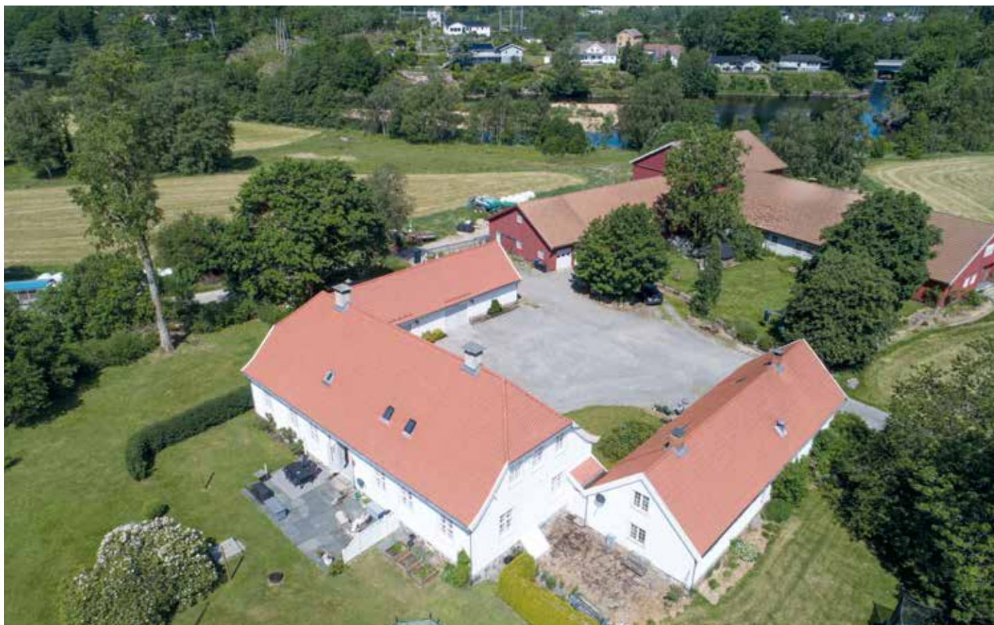
Lyngdal prestegård. Arkitekt Hans Ditlev Franciscus von Linstow, (1787–1851) tegnet det Kongelige slott, men også Lyngdal prestegård i Agder.